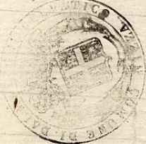
Autorisation de circuler pour un joueur d'orgue de barbarie et sa famille (1856) (E 026/025 - 115)