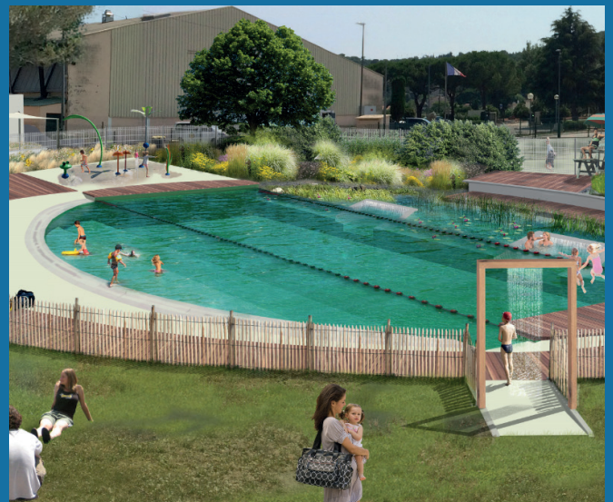
Bassin écologique à Villeneuve-Loubet