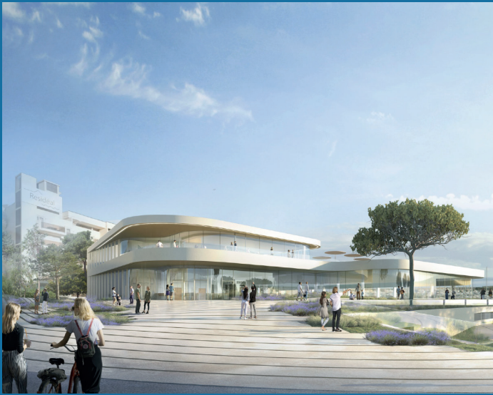
Phase 2 du stade nautique à Antibes