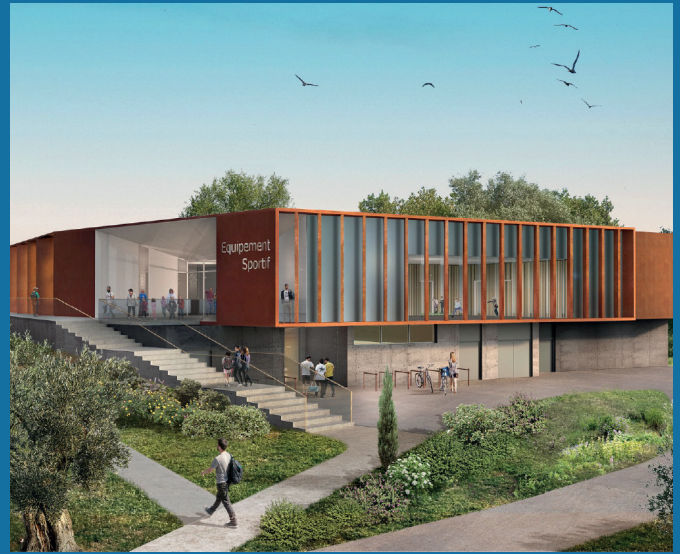
Équipement sportif stade Gilbert Auvergne à Antibes