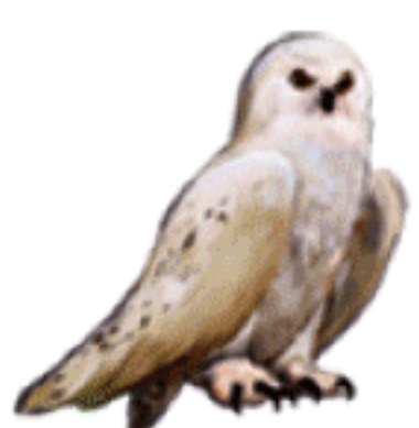
Harfang des neiges

Parmi ces animaux, lesquels sont représentés dans la faune du Lazaret il y a 160 000 ans ? (Entoure leur nom)