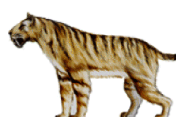
Tigre à dents de sabre