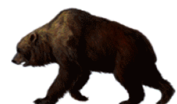
ours des cavernes