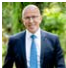
Eric Ciotti Député, Président de la commission des finances du Département des Alpes-Maritimes

C'était il y a 80 ans. Et pourtant, à l'heure où la guerre est aux portes de l'Europe, il est plus que jamais nécessaire de maintenir les consciences en alerte et de retenir les leçons du passé.