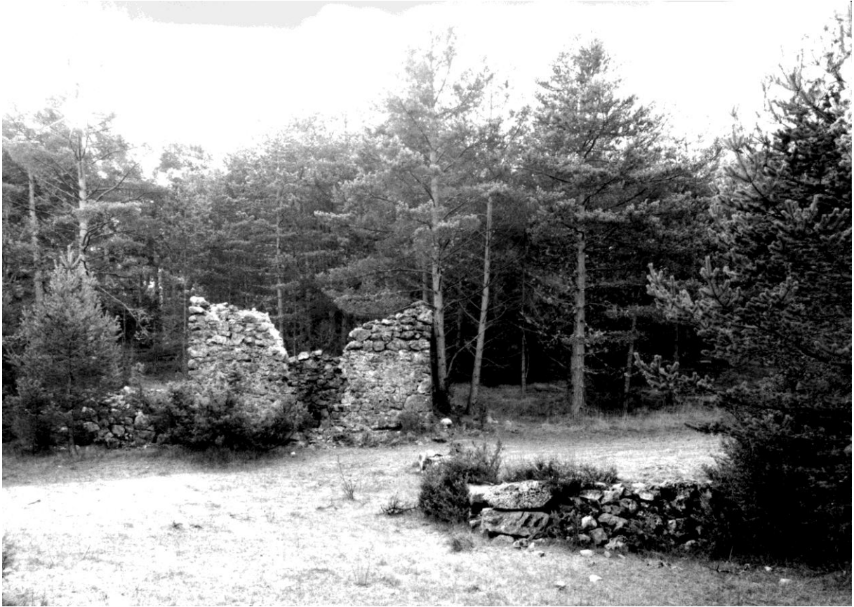
Fig. 97. Vue de situation, depuis le nord