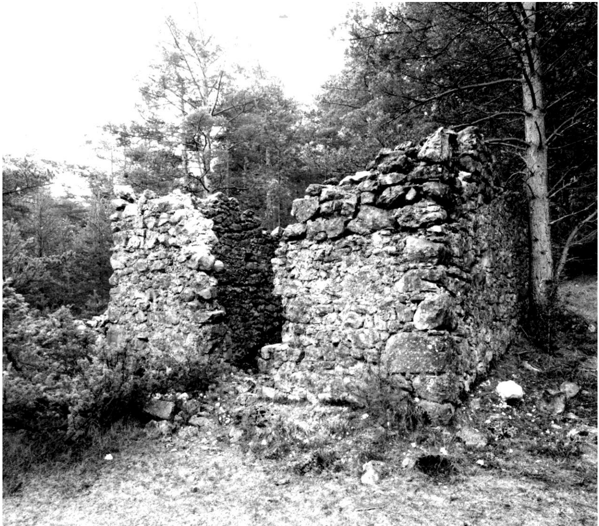
Fig. 98. Vue d'ensemble, depuis le nord-ouest © Conseil général des Alpes-Maritimes, inventaire du patrimoine culturel, M. Graniou, 1994 Référence : 17Fi5306