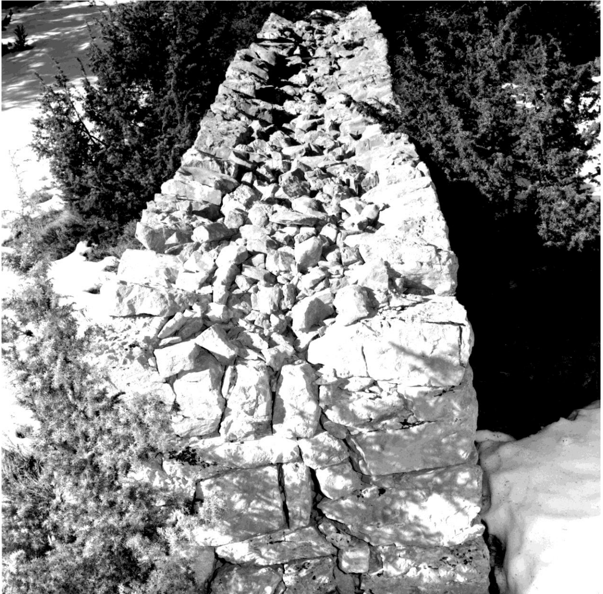
Fig. 119. Mur sud, détail : le blocage entre les deux parements, vu depuis l'est Référence : 17Fi5948