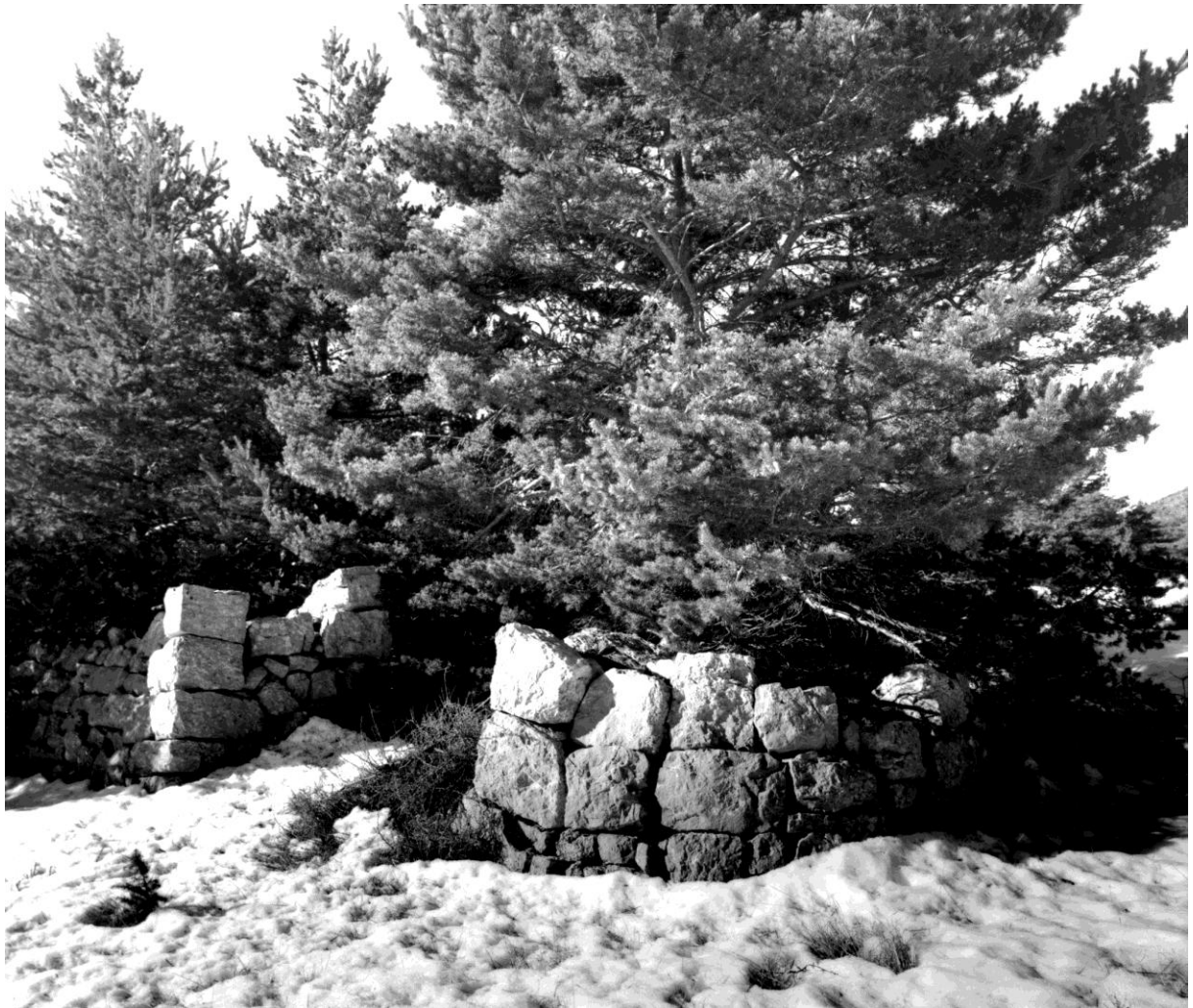
Fig. 120. Angle nord-est, détail : l'une des portes (construction inachevée), vue depuis le nord-est