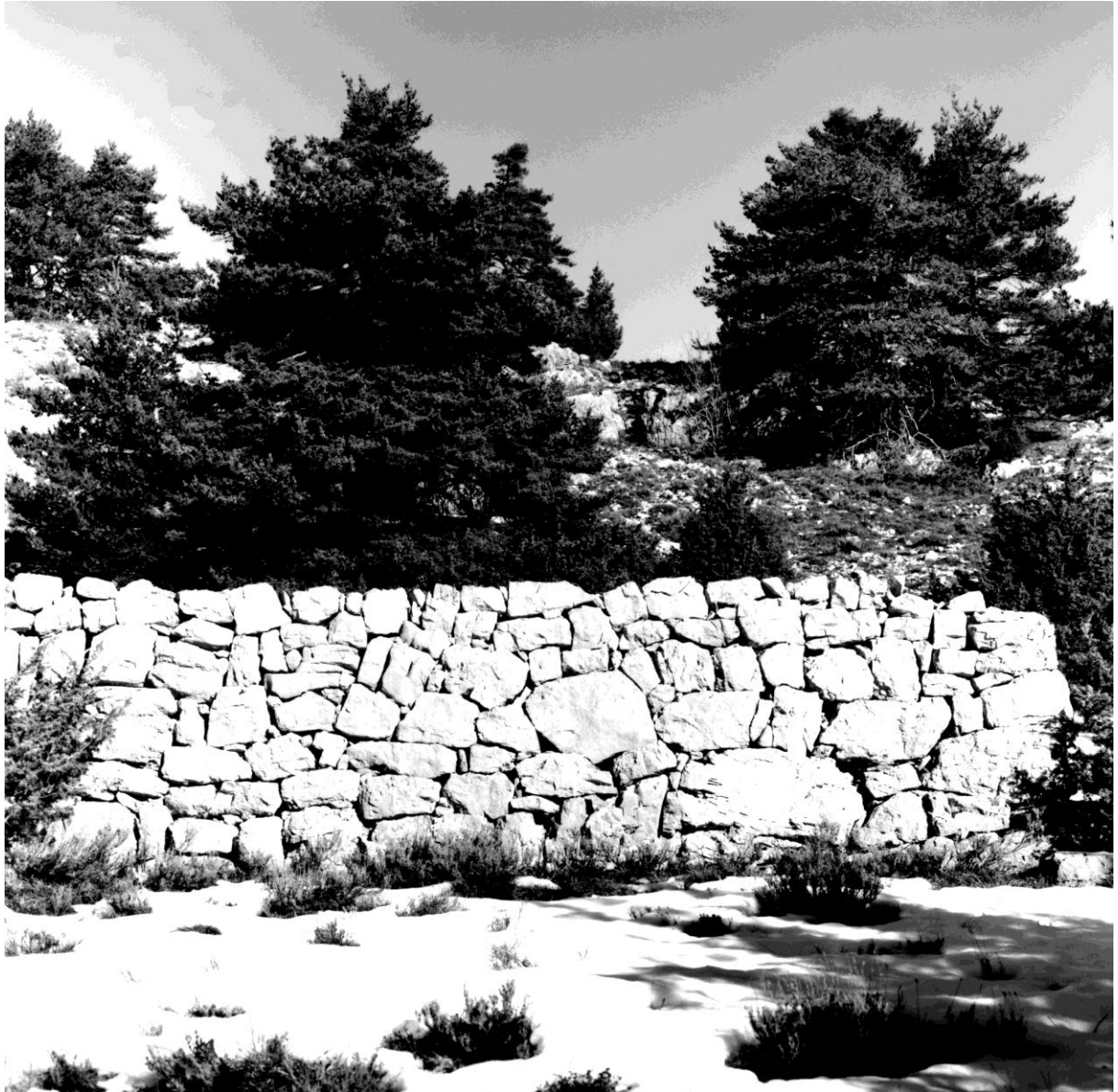
Fig. 118. Mur sud, détail : l'assemblage du parement extérieur, vu depuis le sud © Conseil général des Alpes-Maritimes, inventaire du patrimoine culturel, M. Graniou, 1994 Référence : 17Fi5950