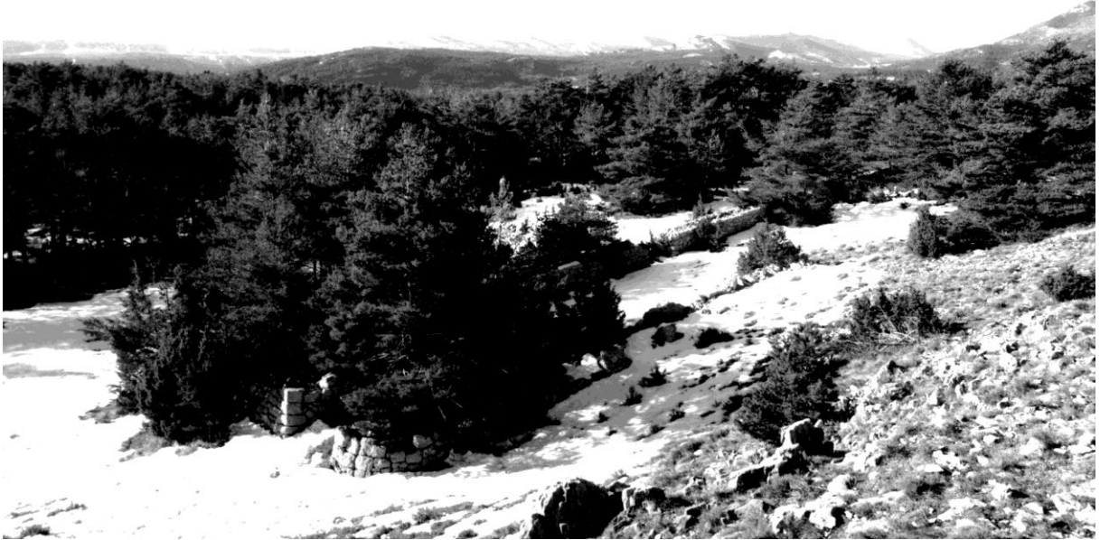
Fig. 117. Vue de situation, depuis le nord-est