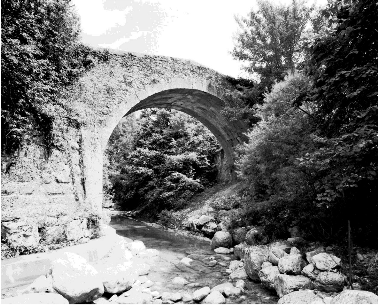
Fig. 121. Vue d'ensemble, depuis l'ouest (côté amont) © Conseil général des Alpes-Maritimes, inventaire du patrimoine culturel, M. Graniou, 1994 Référence : 17Fi4578