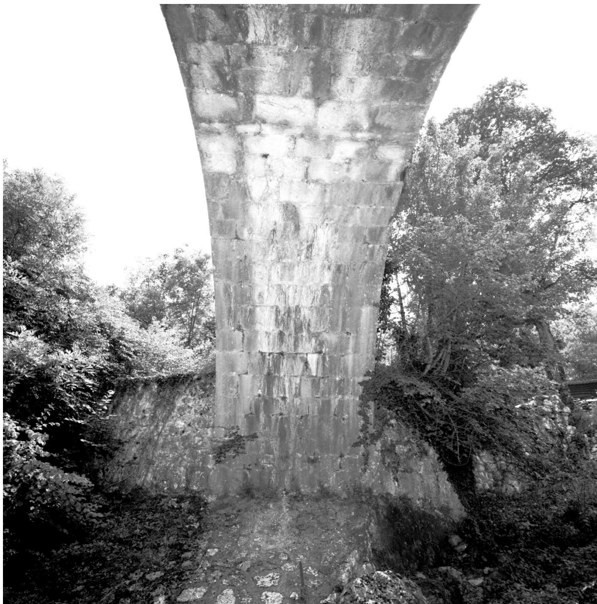
Fig. 122. La voûte de l'arche, vue depuis le nord © Conseil général des Alpes-Maritimes, inventaire du patrimoine culturel, M. Graniou, 1994 Référence : 17Fi4579