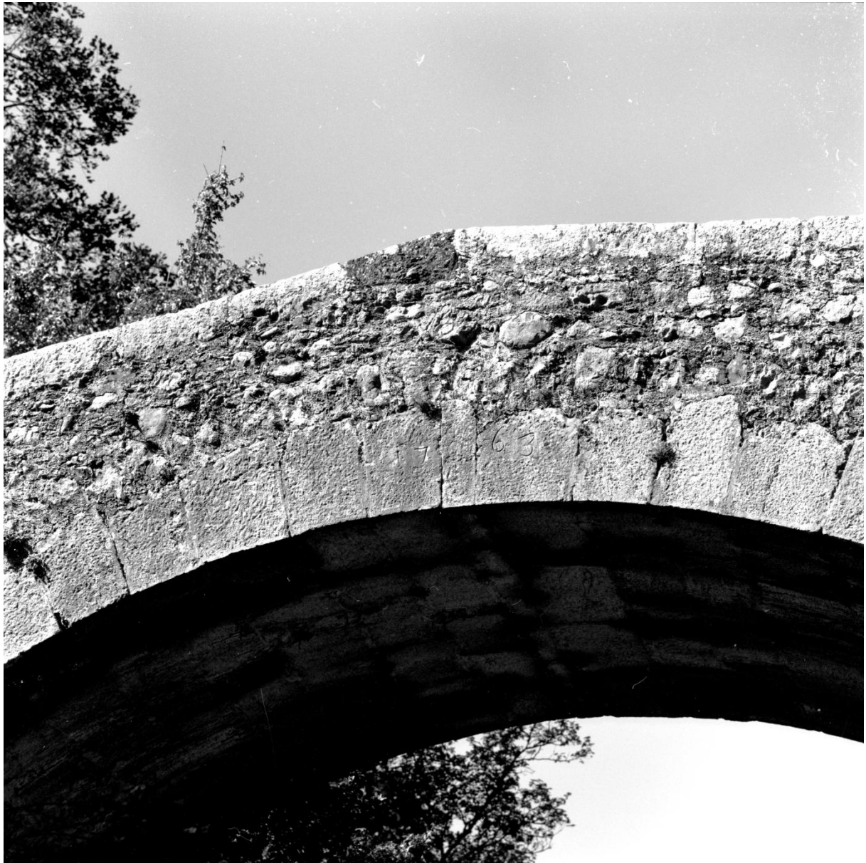
Fig. 123. Détail : la date portée sur deux claveaux (de part et d'autre de la clef), vue depuis l'est (côté aval)

Référence : 17Fi5002