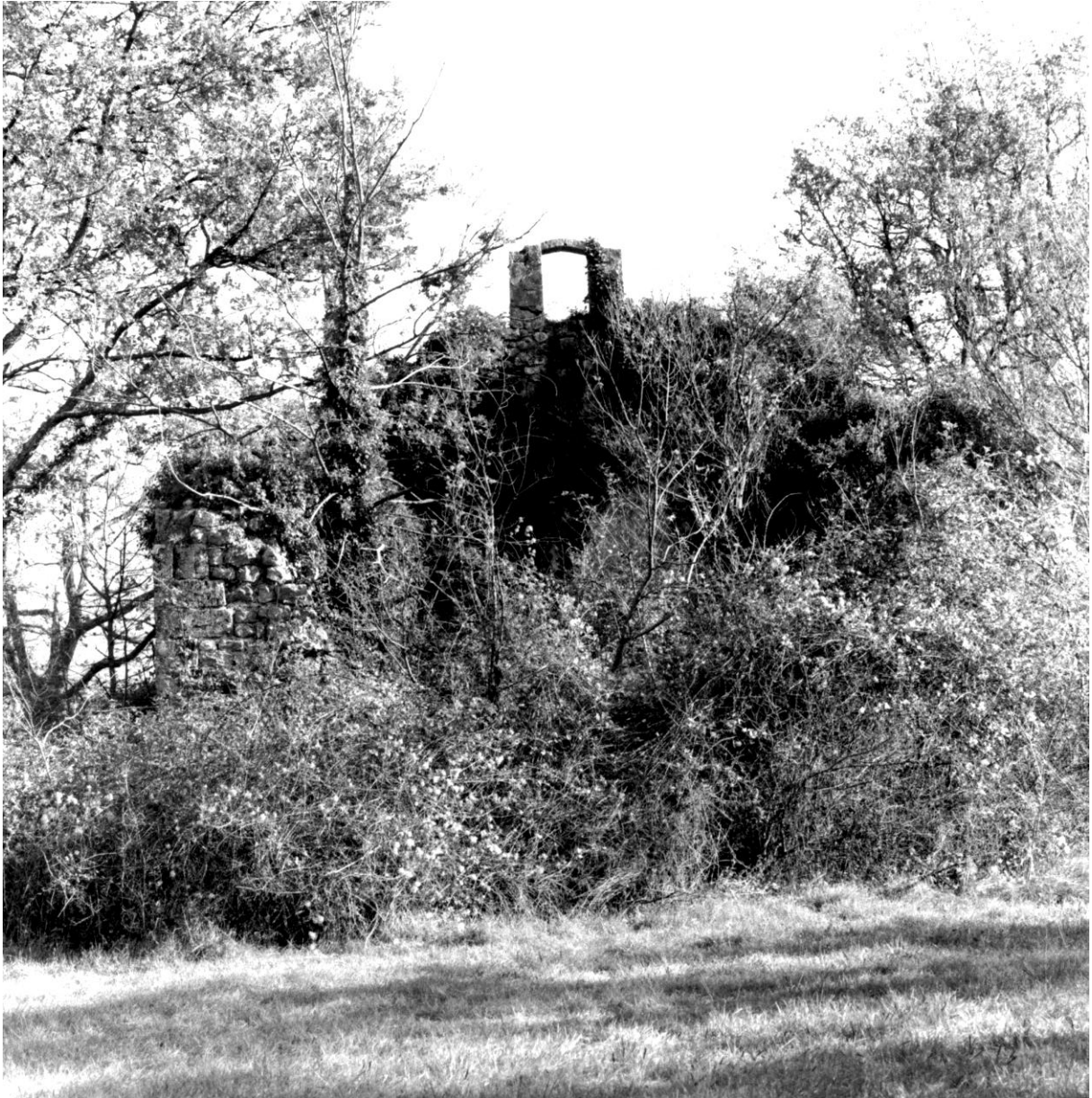
Fig. 59. Vue depuis l'ouest de l'ensemble de l'édifice et de la végétation qui le cachait encore en 1994