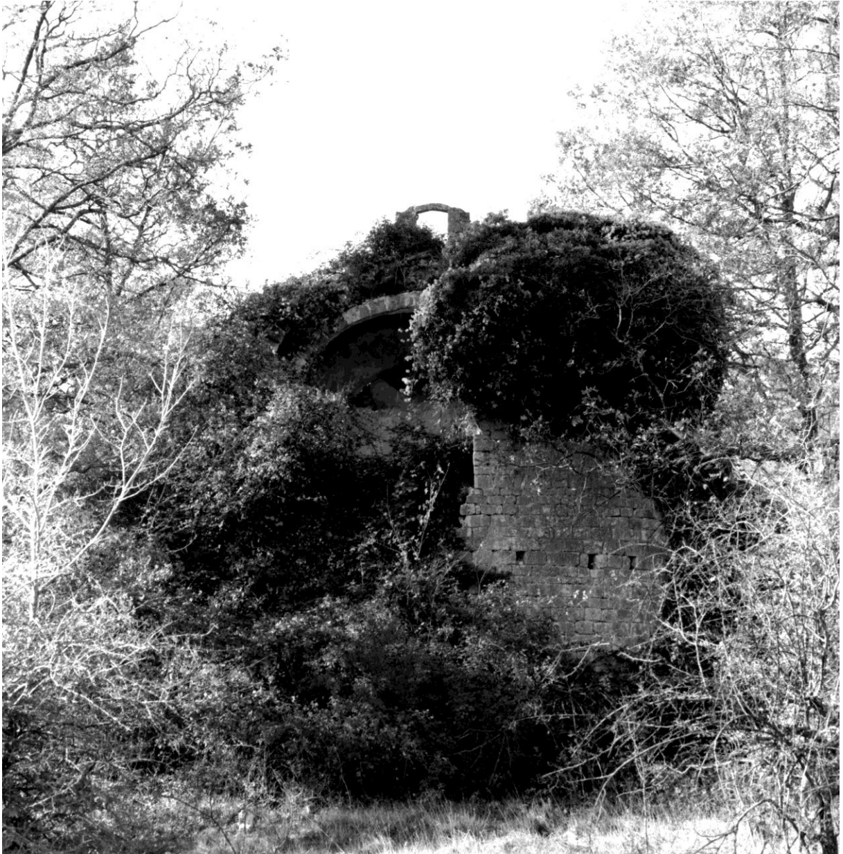
Fig. 60. Le chevet, vu depuis l'est