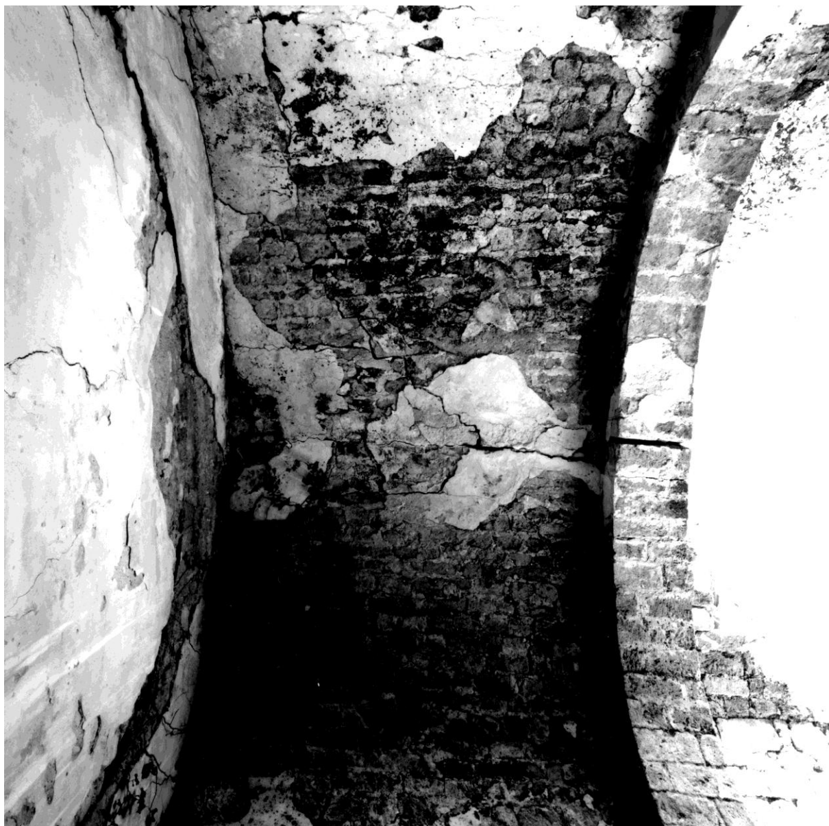
Fig. 65. Partie postérieure de l'édifice, voûte de la première travée, vue de bas en haut (le chœur est à droite de la photographie)