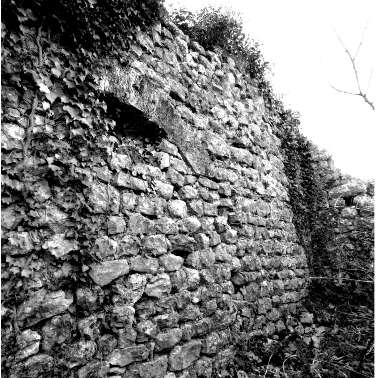
Fig. 64. Partie antérieure de l'édifice, parement intérieur de l'élévation sud et l'un des arcs segmentaires, aveugles, en tuf, vus du nord Référence : 17Fi5292