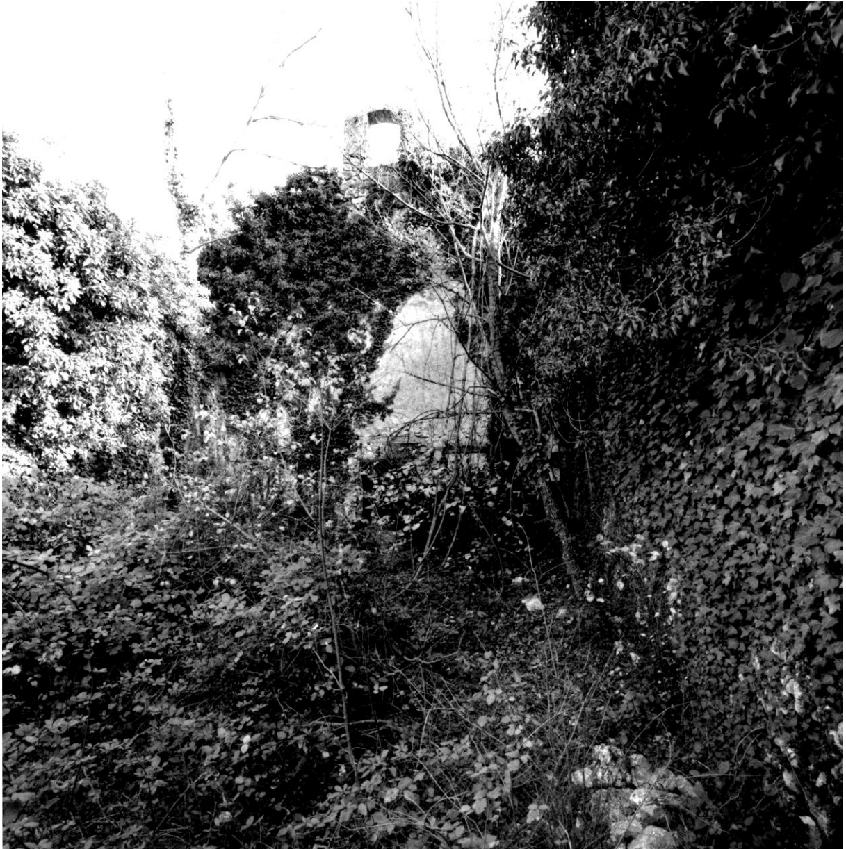
Fig. 63. Partie antérieure de l'édifice, vue intérieure depuis l'ouest Référence : 17Fi5291