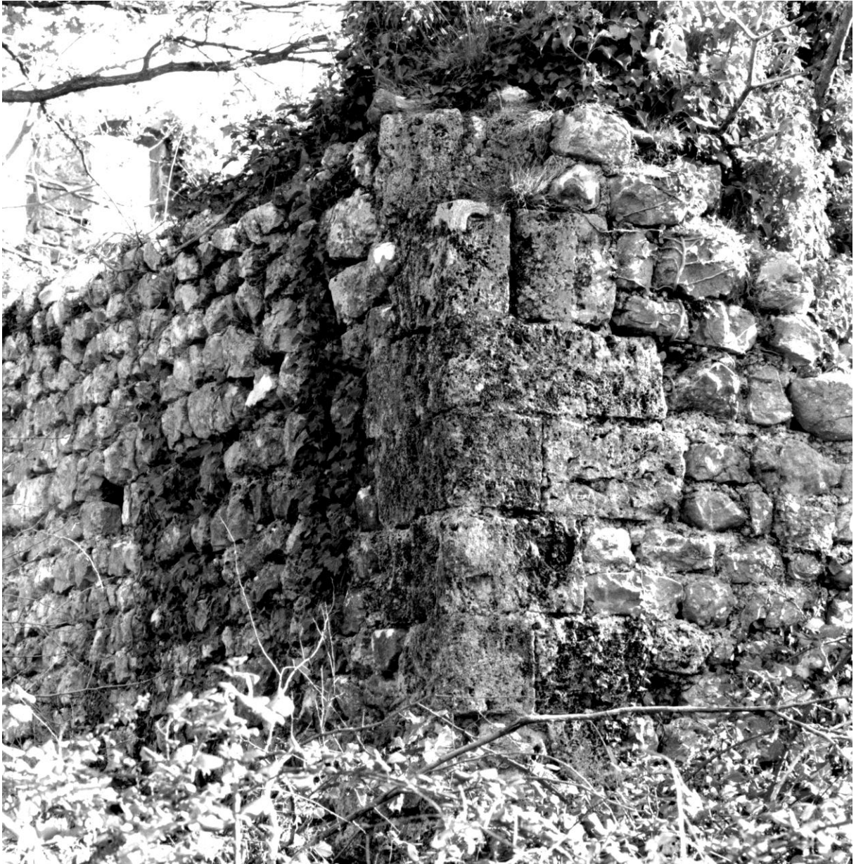
Fig. 62. Partie antérieure de l'édifice, détail : l'angle nord-ouest et son chaînage de tuf, vu du nord-ouest