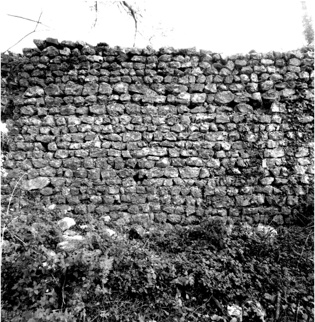
Fig. 61. Partie antérieure de l'édifice, parement extérieur de l'élévation nord, vu du nord