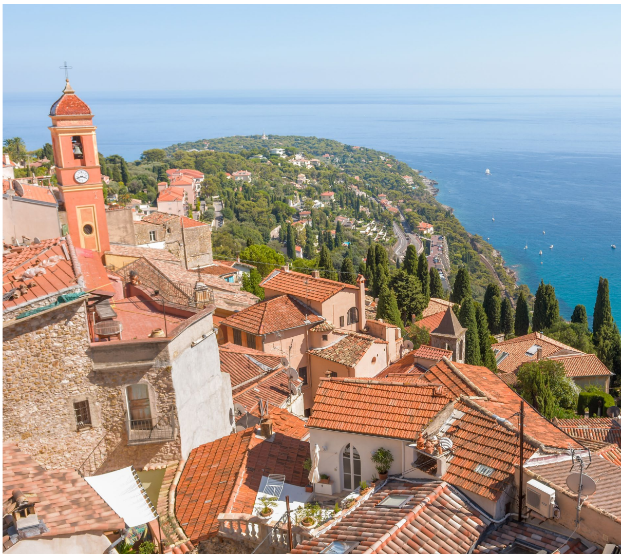
Village de Roquebrune-Cap-Martin