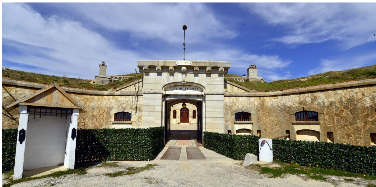
Fort de la Drète