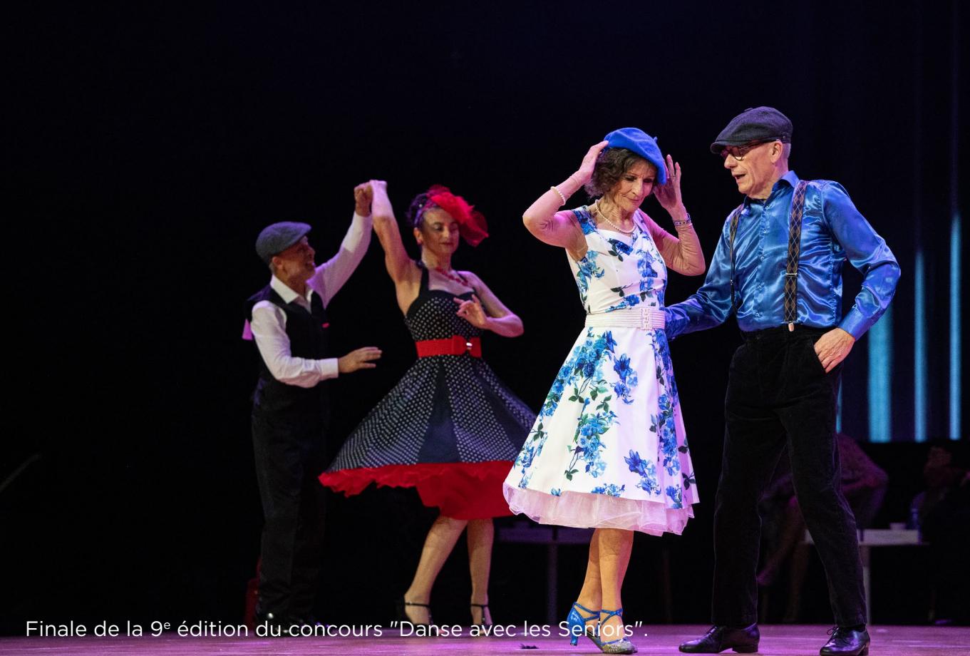
Finale de la 9 e édition du concours "Danse avec les Seniors".