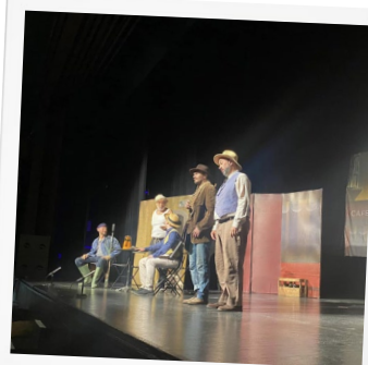
Festival Théâtre Seniors