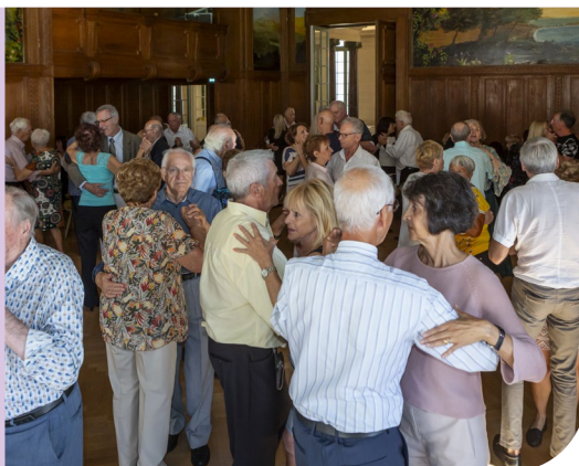
Bal au Palais des Rois Sardes

Accueil à partir de 14h La salle ne sera plus accessible après 15h