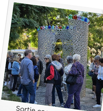
Sortie cœur de ville Nice nord