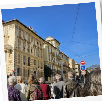
Sortie cœur de ville Nice nord