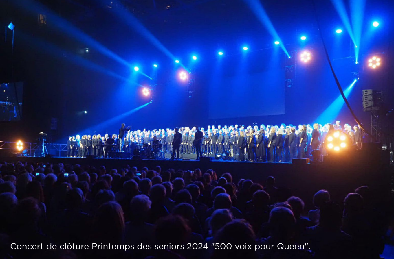
Concert de clôture Printemps des seniors 2024 "500 voix pour Queen".