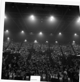
Quinzaine des seniors : concert de clôture ...

Vous avez été nombreux à participer aux événements organisés par le Département en 2024 !