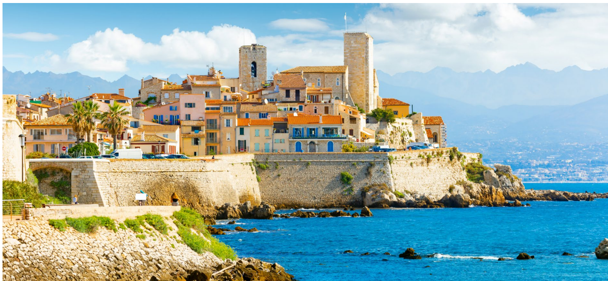
Ville d'Antibes