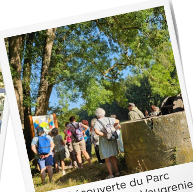
Découverte du Parc Départemental de Vaugrenier et de son patrimoine

SUIVEZ TOUTE L'ACTU DÉDIÉE AUX SENIORS EN REJOIGNANT LE GROUPE FACEBOOK « SENIORS 06 »