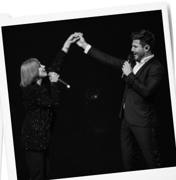
... Natacha St Pier & Vincent Niclo