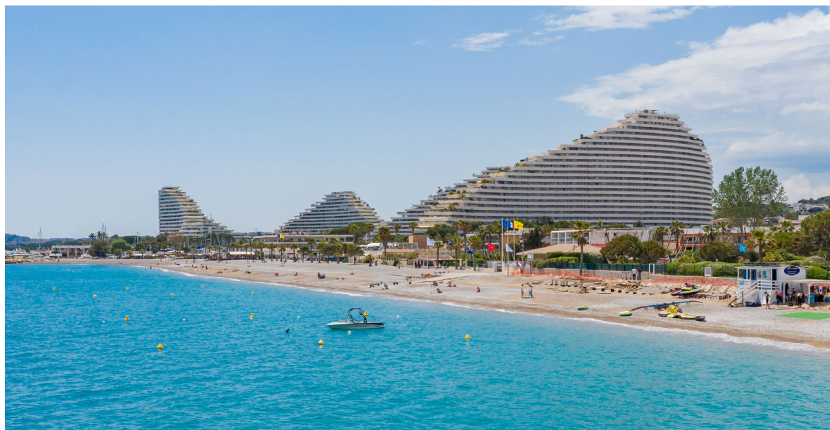
Villeneuve-Loubet, Marina Baie des Anges

Vendredi 25 avril, jeudi 15 mai et mardi 10 juin 2025