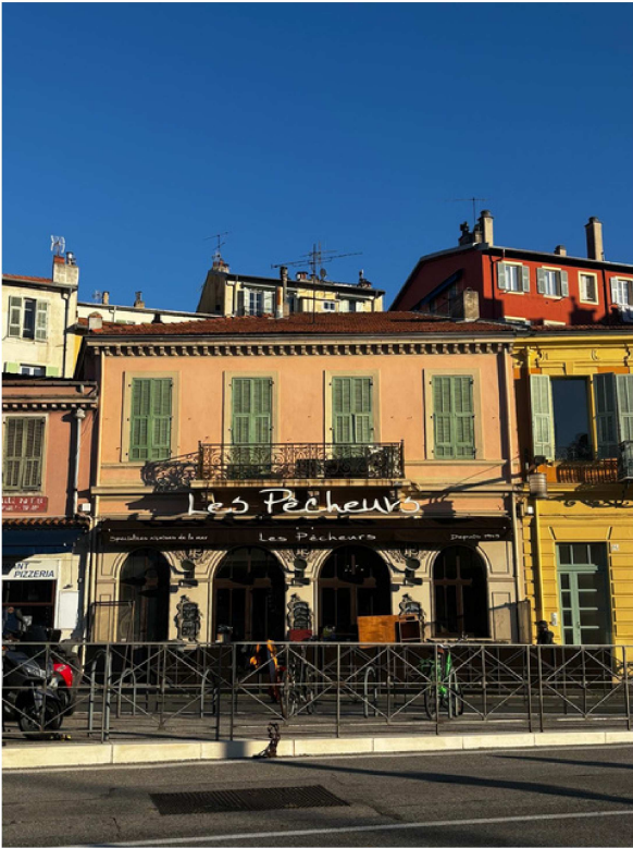
Facade QUAI Des DOCKS