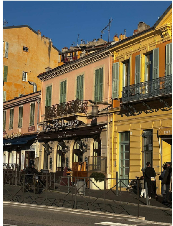
Façade Rle des Moulins