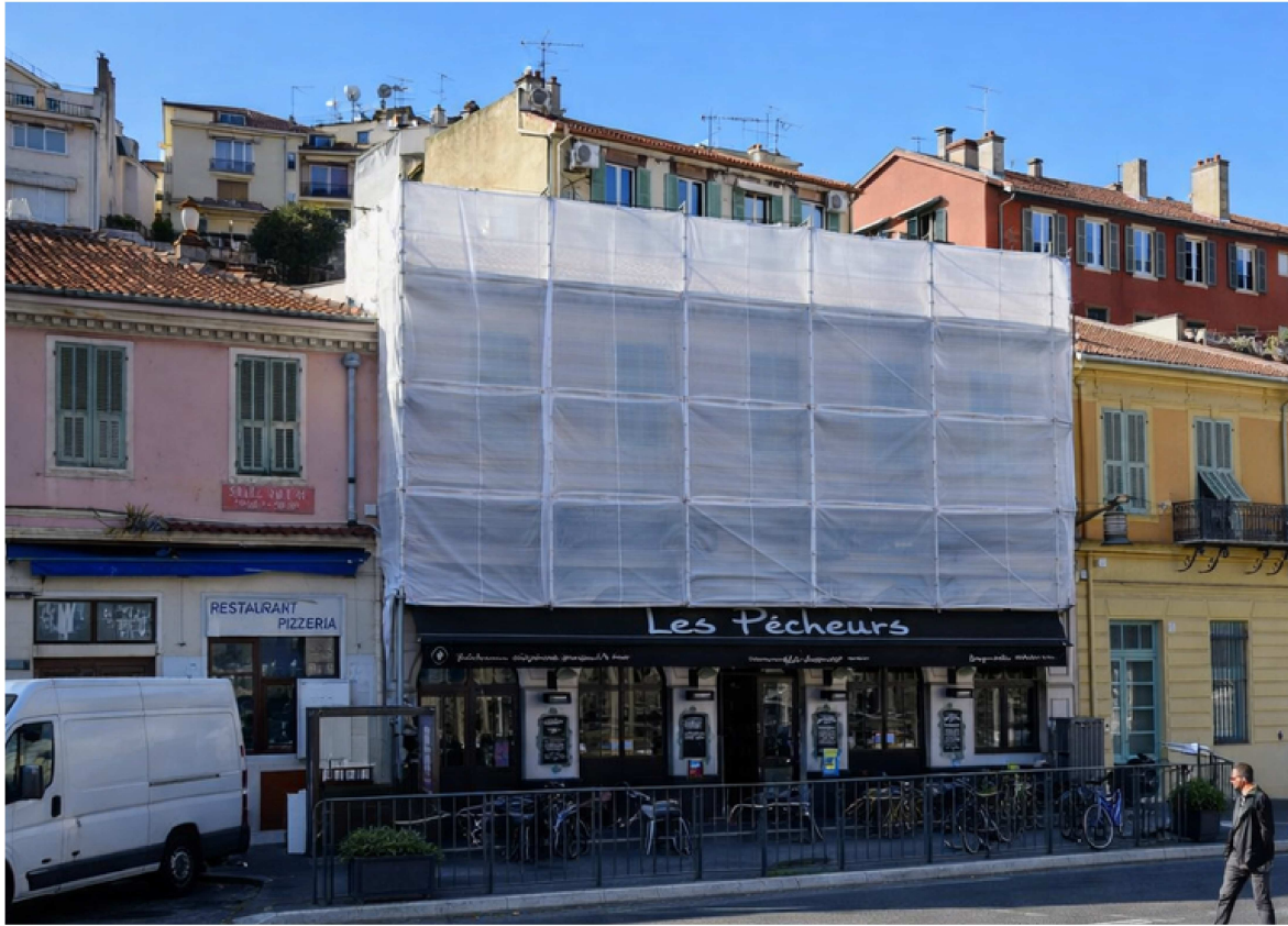
Facade QUAI Des DOCKS